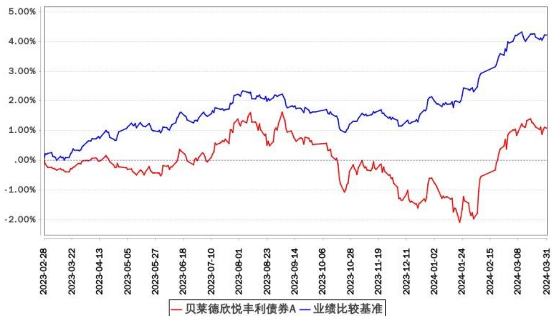
贝莱德欣悦丰利债券A累计净值增长率与同期业绩比较基准收益率的历史走势对比图